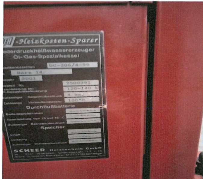
Zdjęcie 2. Tabliczka znamionowa kotła