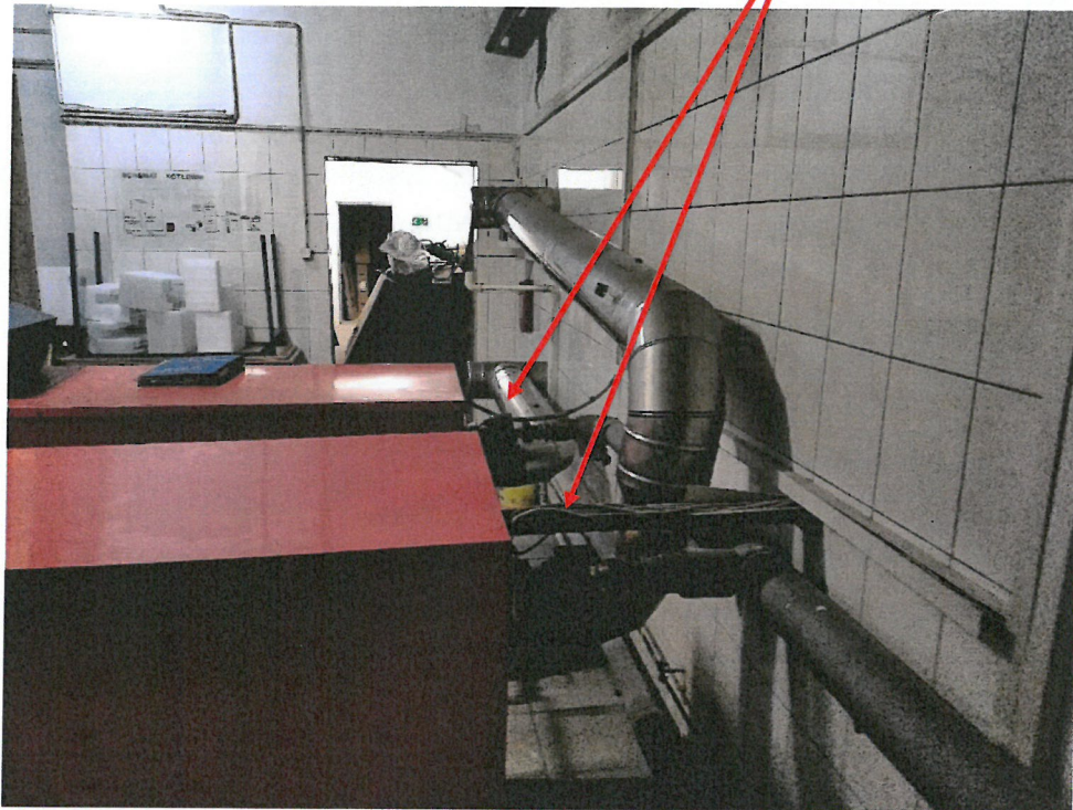
Zdjęcie 6. Widok instalacji kotła z tyłu.

Lokalizacja pomp obiegu kotłowego (DN 32)