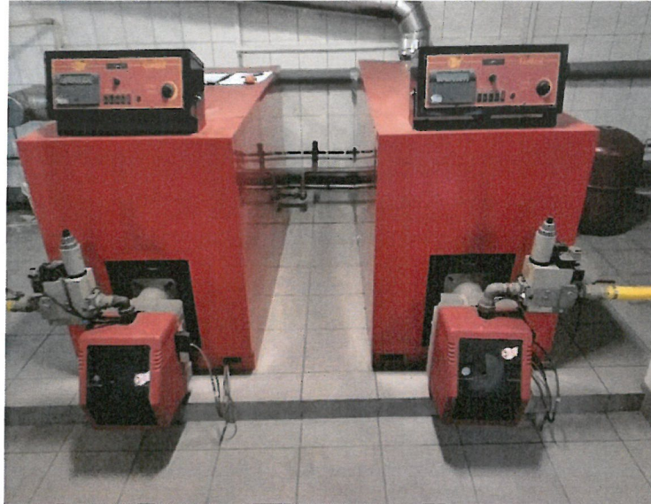
Zdjęcie 1. Widok kotłów