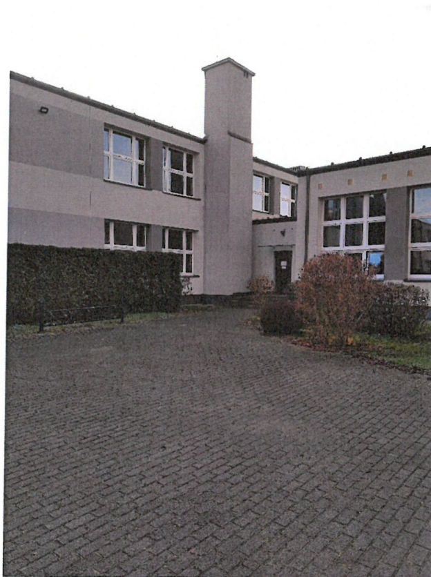
Zdjęcie 4. Zewnętrzny komin spalinowy

[wysokość komina (wkładów kominowych) od czopucha kotłów do wylotu to około 13,00 m]. Istniejący układ technologiczny obrazuje poniższy schemat.