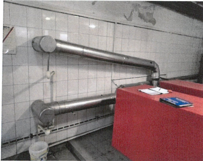
Zdjęcie 3. Poziome przewody spalinowe [„czopuchy”: L poz.1=1,5 m i L poz.2=2,6 m]